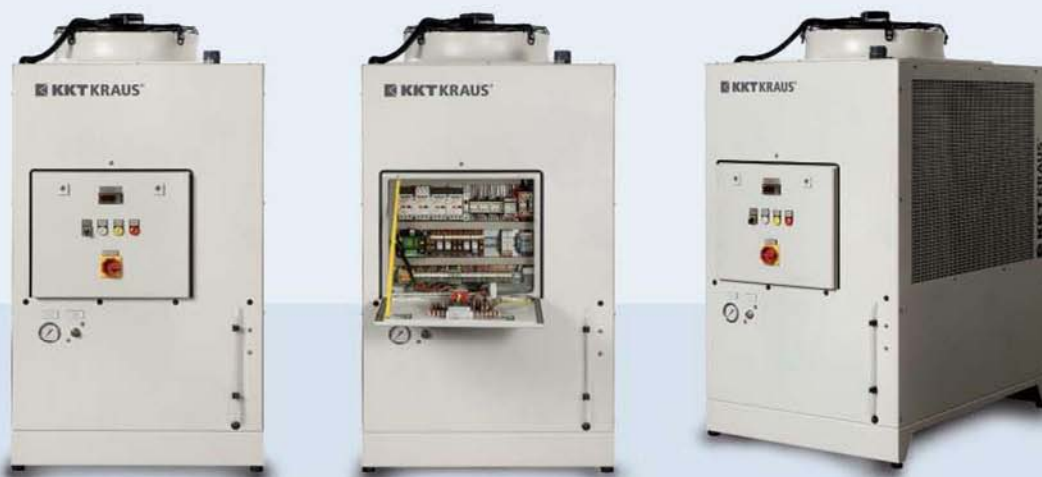
Ausschnitt unserer Referenzen im Bereich Industriekühlung

OLB 25 27,0 KW bei 20\text{ °C} Austrittstemperatur und 32\text{ °C} Umgebungstemperatur