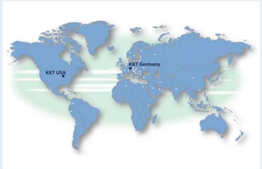
Weltweit präsent und professionell: Das KKT Service-Netzwerk

ABB, Airbus, Audi, Bergmann & Steffen, BMW, Brose Fahrzeugteile, Buderus, Daimler Chrysler, Ford, Fraunhofer Institut Lasertechnik, Jaguar, Jenoptik, Johnson Control, MTU Aero Engines, PWO, Robert Bosch, Schaeffler, Siemens, Sonopress, Sony, Texas Instruments, ThyssenKrupp, TRW Automotive, Volkswagen, WISCO, ZF Getriebe